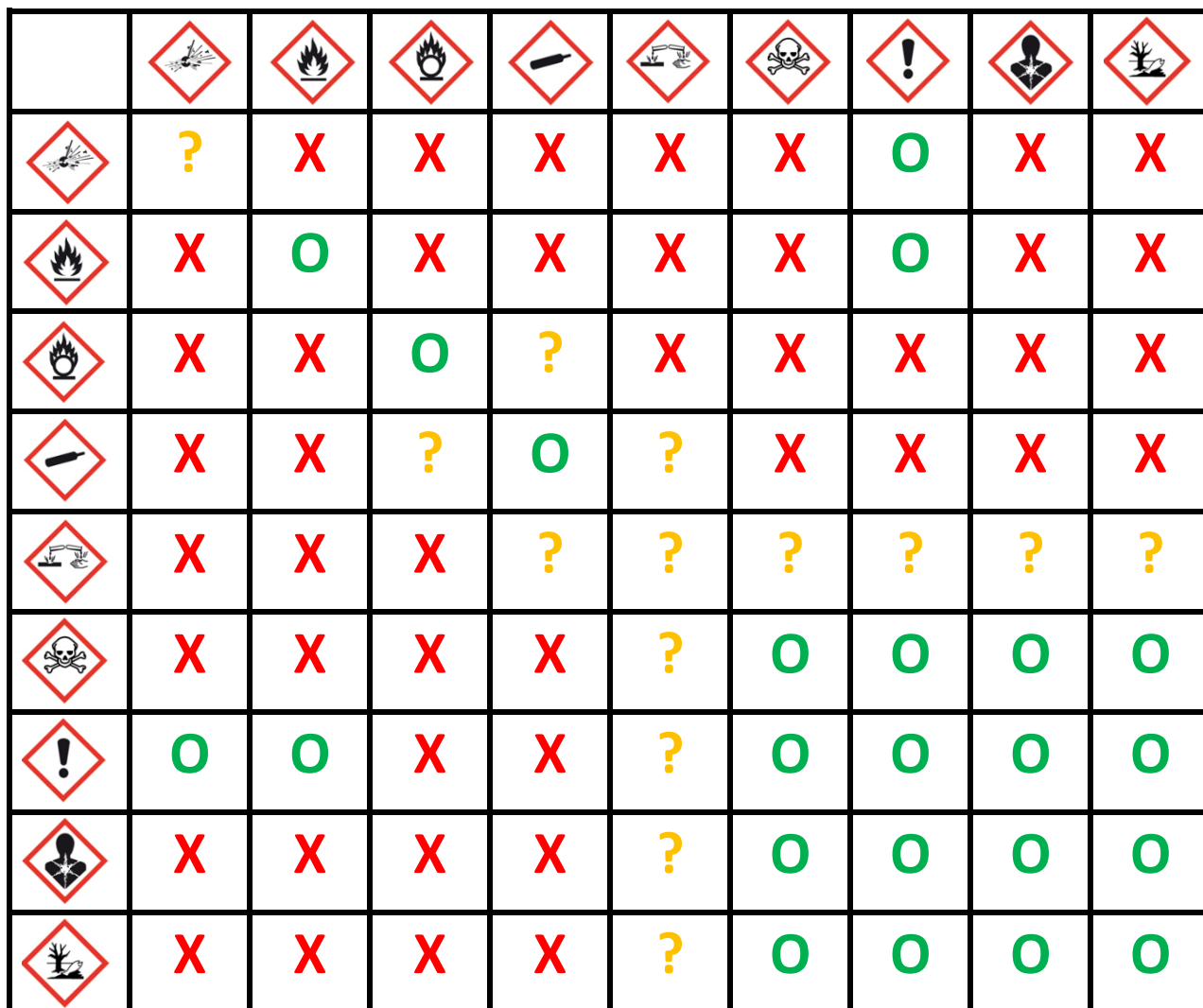
TABLE DE COMPATIBILITE DES PRODUITS CHIMIQUES

ORME CONSEIL - Management du risque chimique, 69006 LYON. Contact@orme-conseil.com